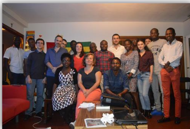
Photo de famille à l'issue de la soirée Go To Togo à Rennes

Soirées Go to Togo - La formule soirée Go to Togo a vu le jour également à Rennes le 24 septembre 2016 avec toute l'équipe de bénévoles pour lancer officiellement l'antenne MAREM Grand Ouest. La seconde édition de la soirée Go to Togo à Gentilly a lieu le 8 octobre 2016 avec la présence de la présidente de